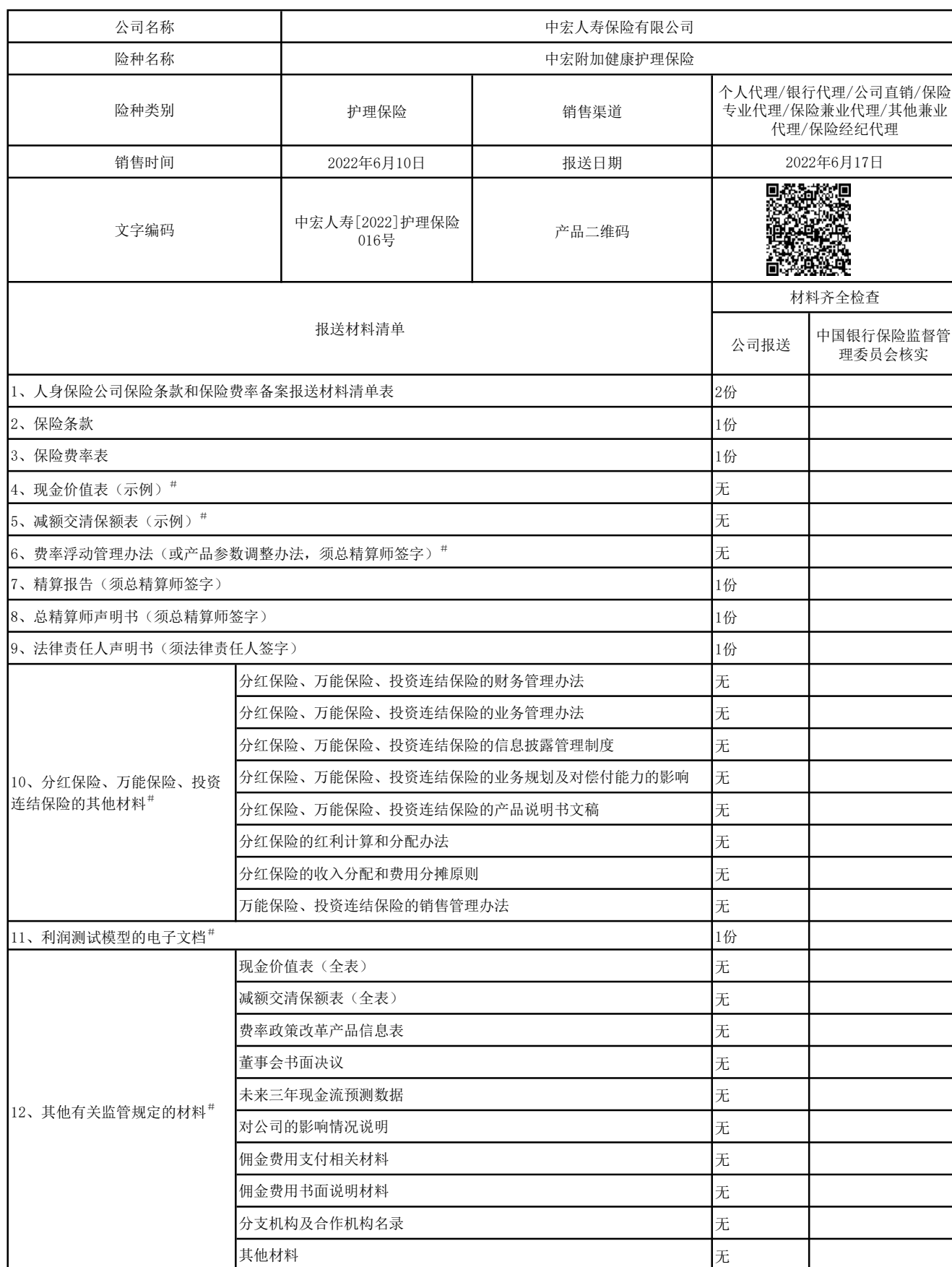
人身保险公司保险条款和保险费率备案报送材料清单表