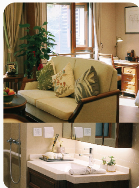
银城君颐东方国际康养社区

绿地国际康养城以“乐养”为指导理念，从健康保健、医疗保障、智能安康、生活照料、娱乐社交、文化教育六个方面出发，全心打造“颐身”、“颐家”、“颐神”、“颐年”、“颐贤”、“颐志”六颐服务。