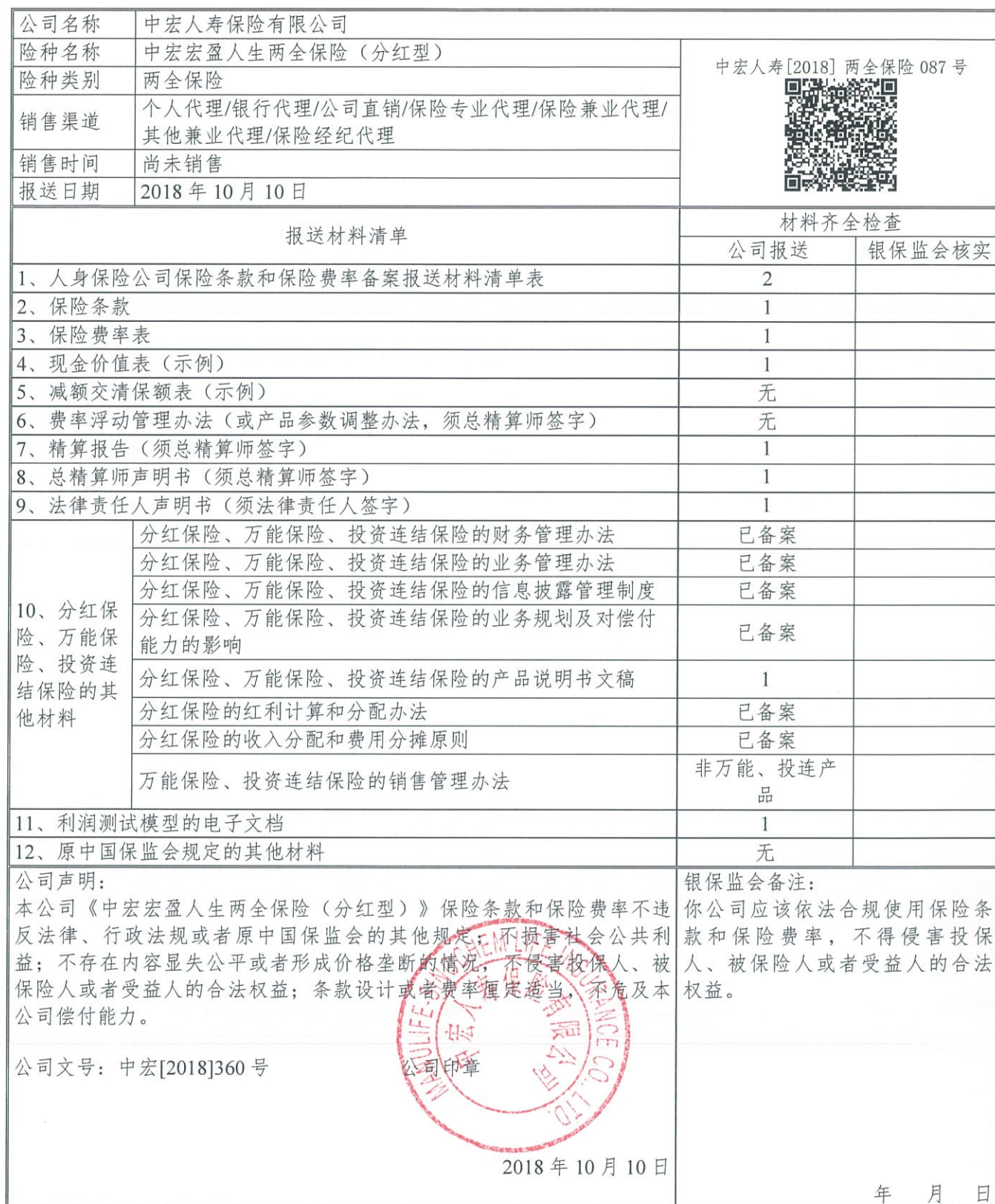
人身保险公司保险条款和保险费率备案报送材料清单表