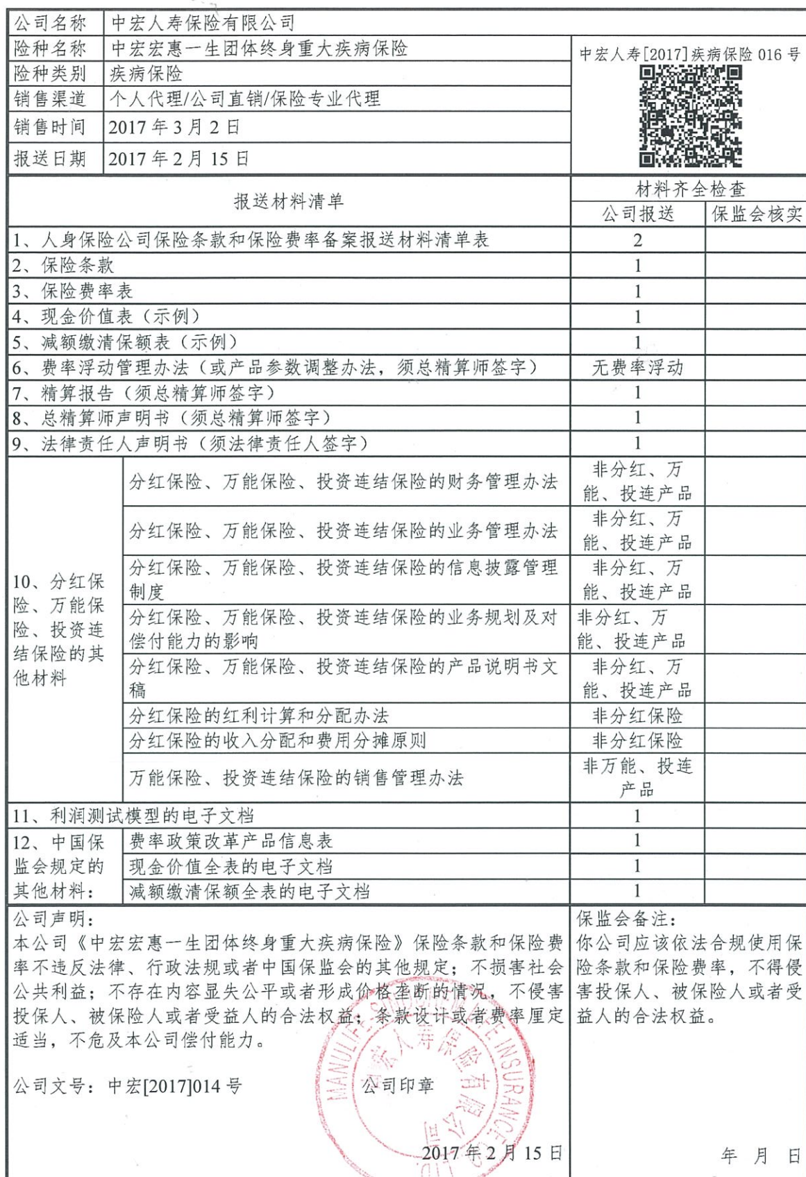
人身保险公司保险条款和保险费率备案报送材料清单表