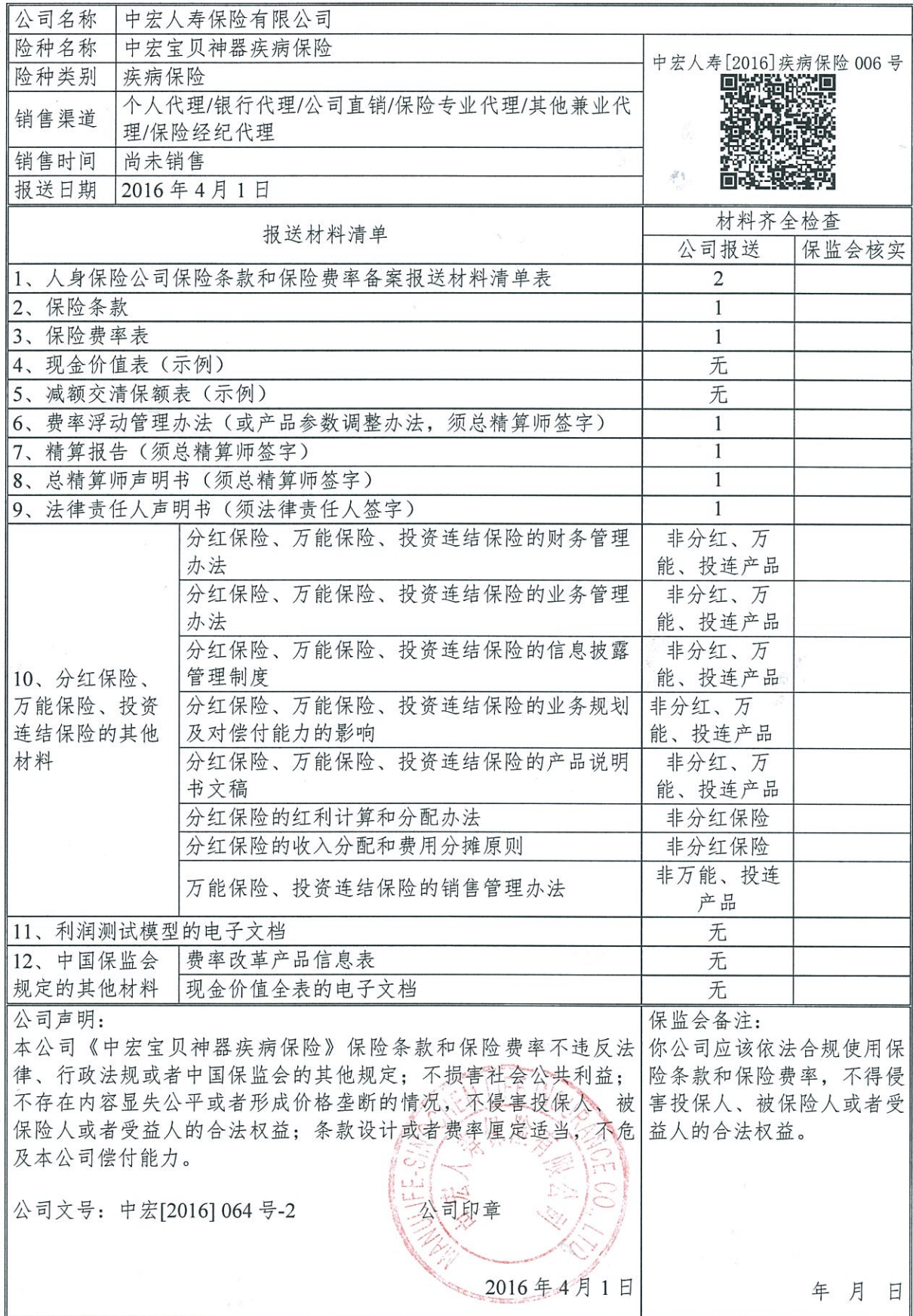
人身保险公司保险条款和保险费率备案报送材料清单表