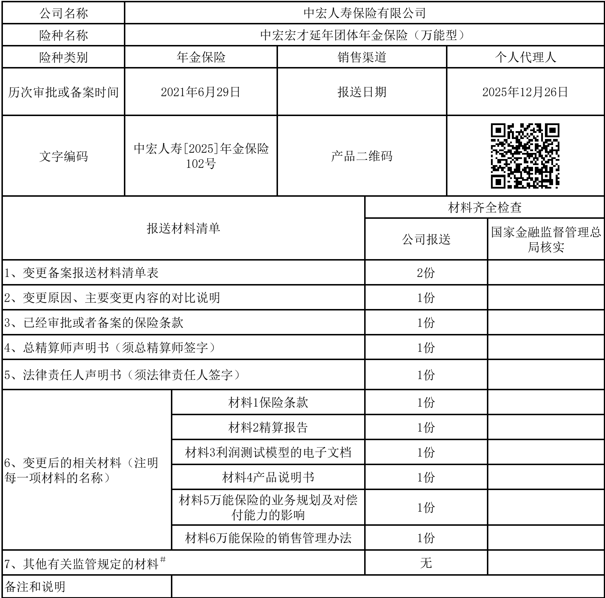
变更备案报送材料清单表