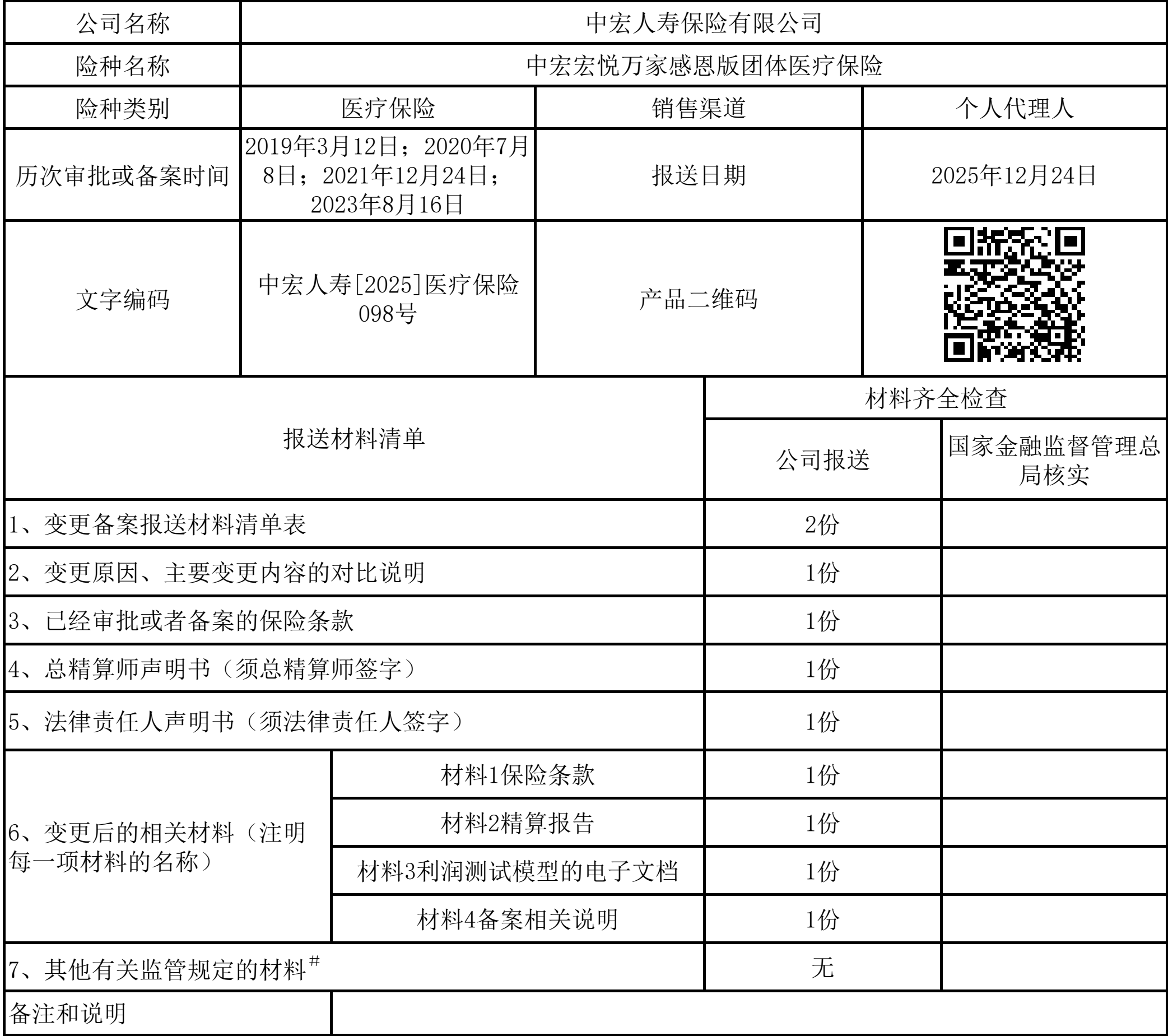
变更备案报送材料清单表