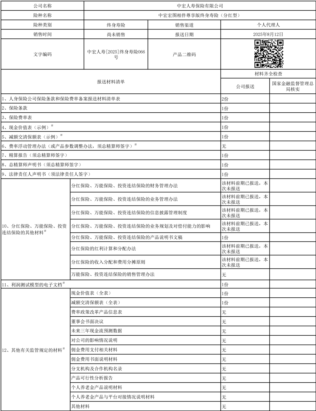
人身保险公司保险条款和保险费率备案报送材料清单表