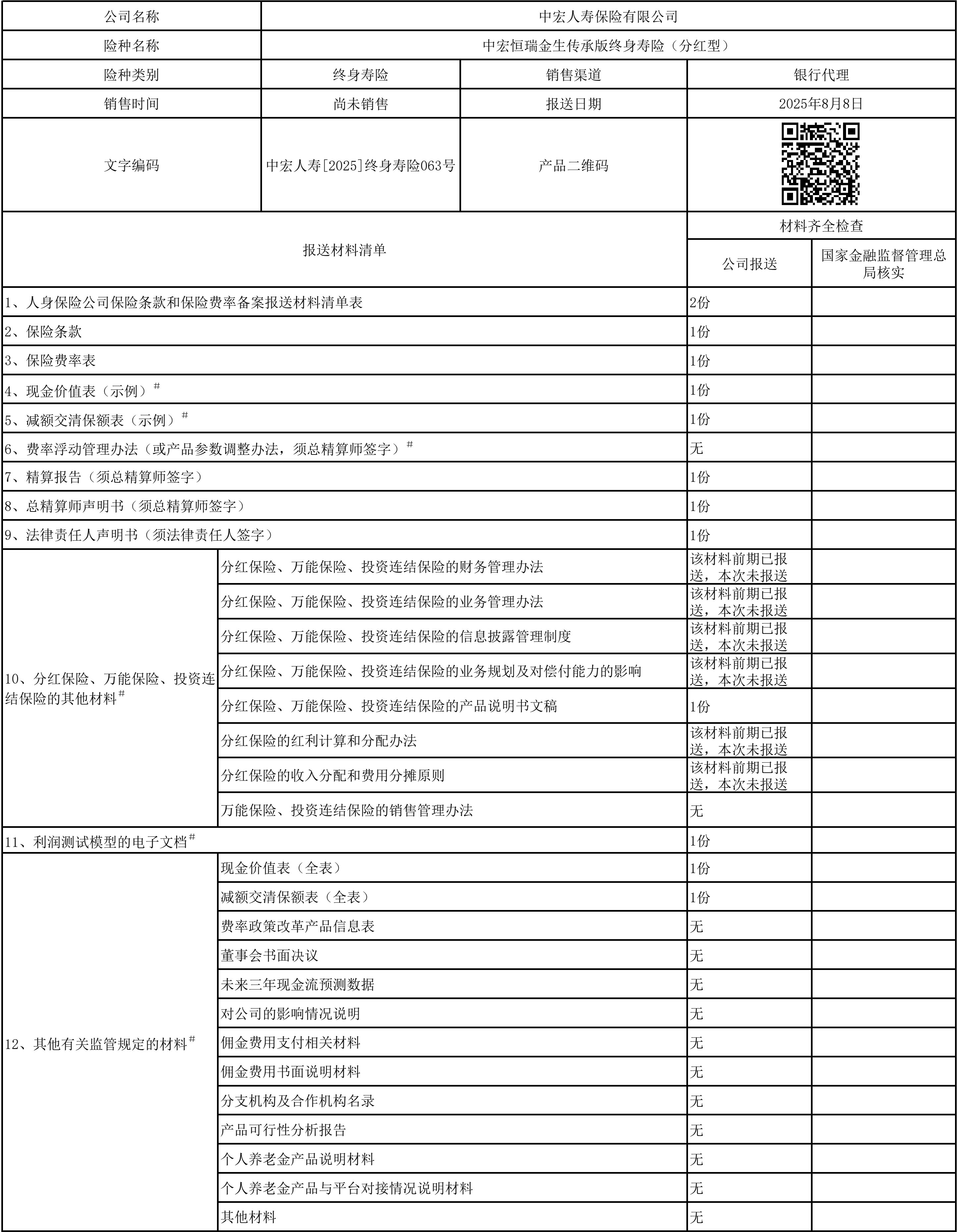
人身保险公司保险条款和保险费率备案报送材料清单表