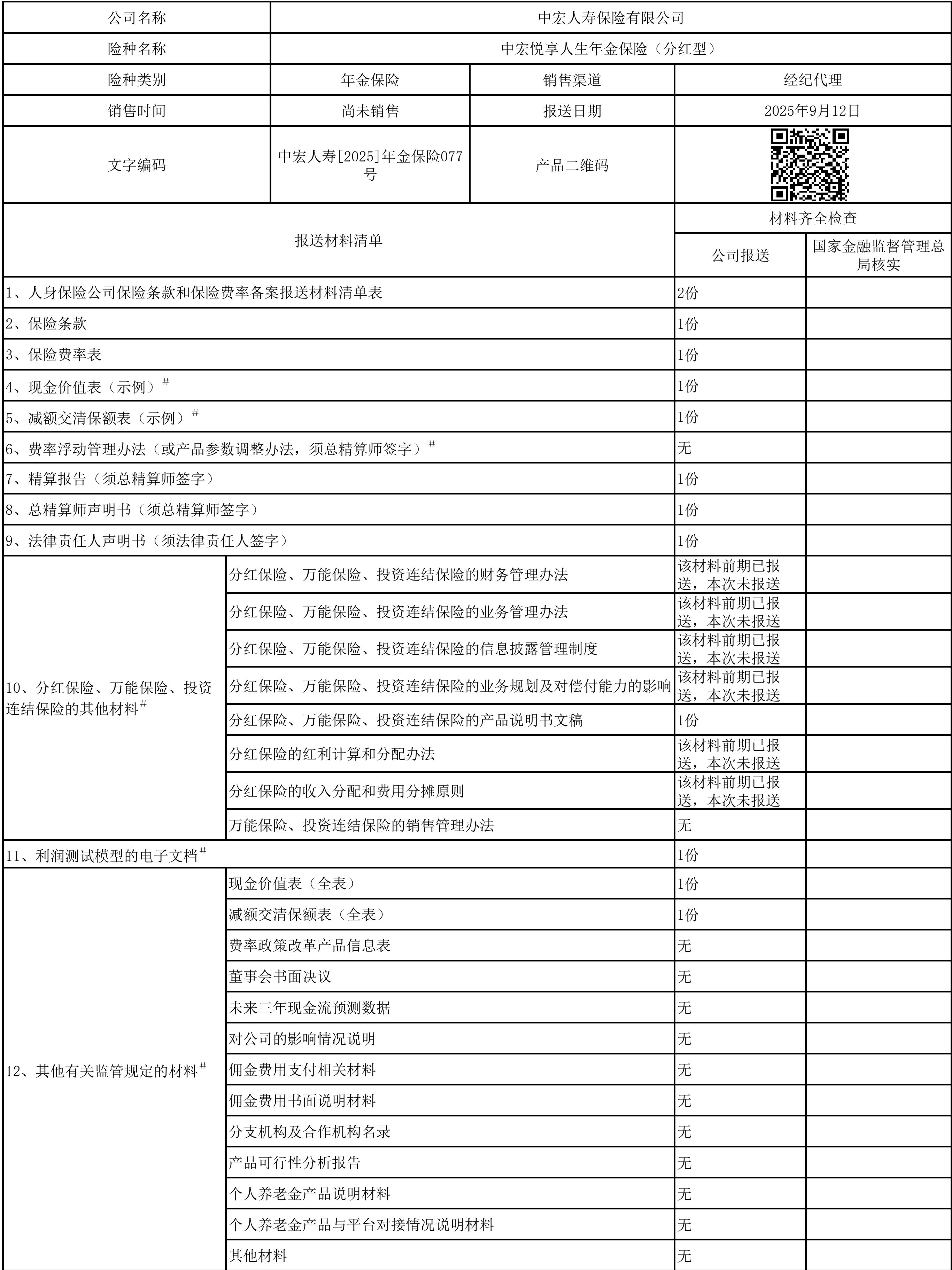
人身保险公司保险条款和保险费率备案报送材料清单表