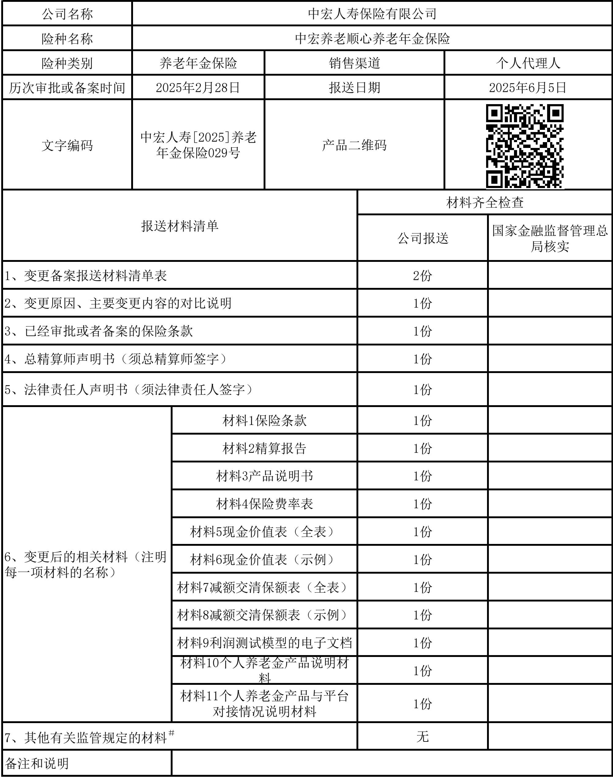
变更备案报送材料清单表