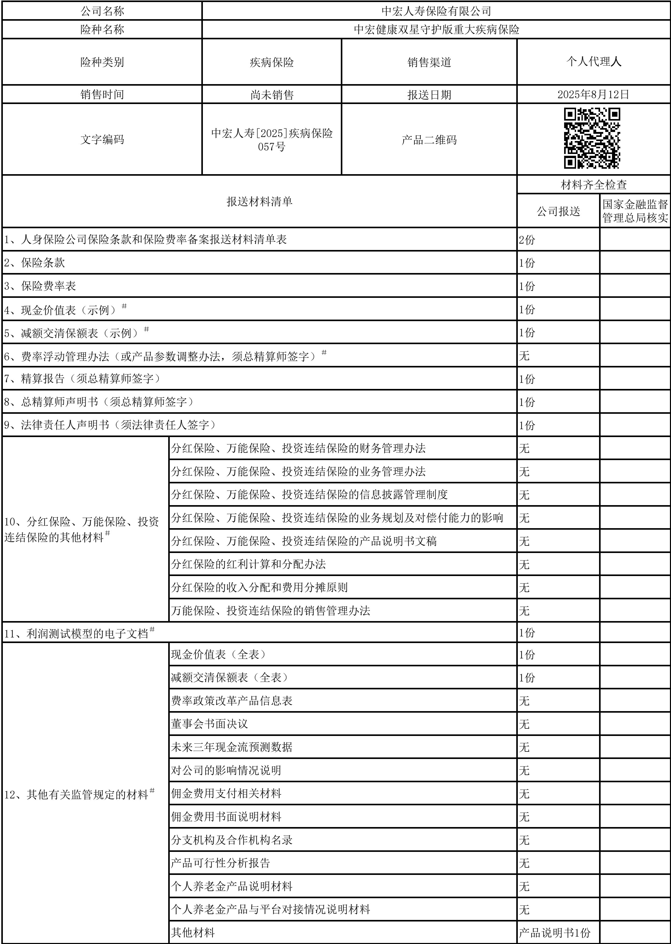
人身保险公司保险条款和保险费率备案报送材料清单表