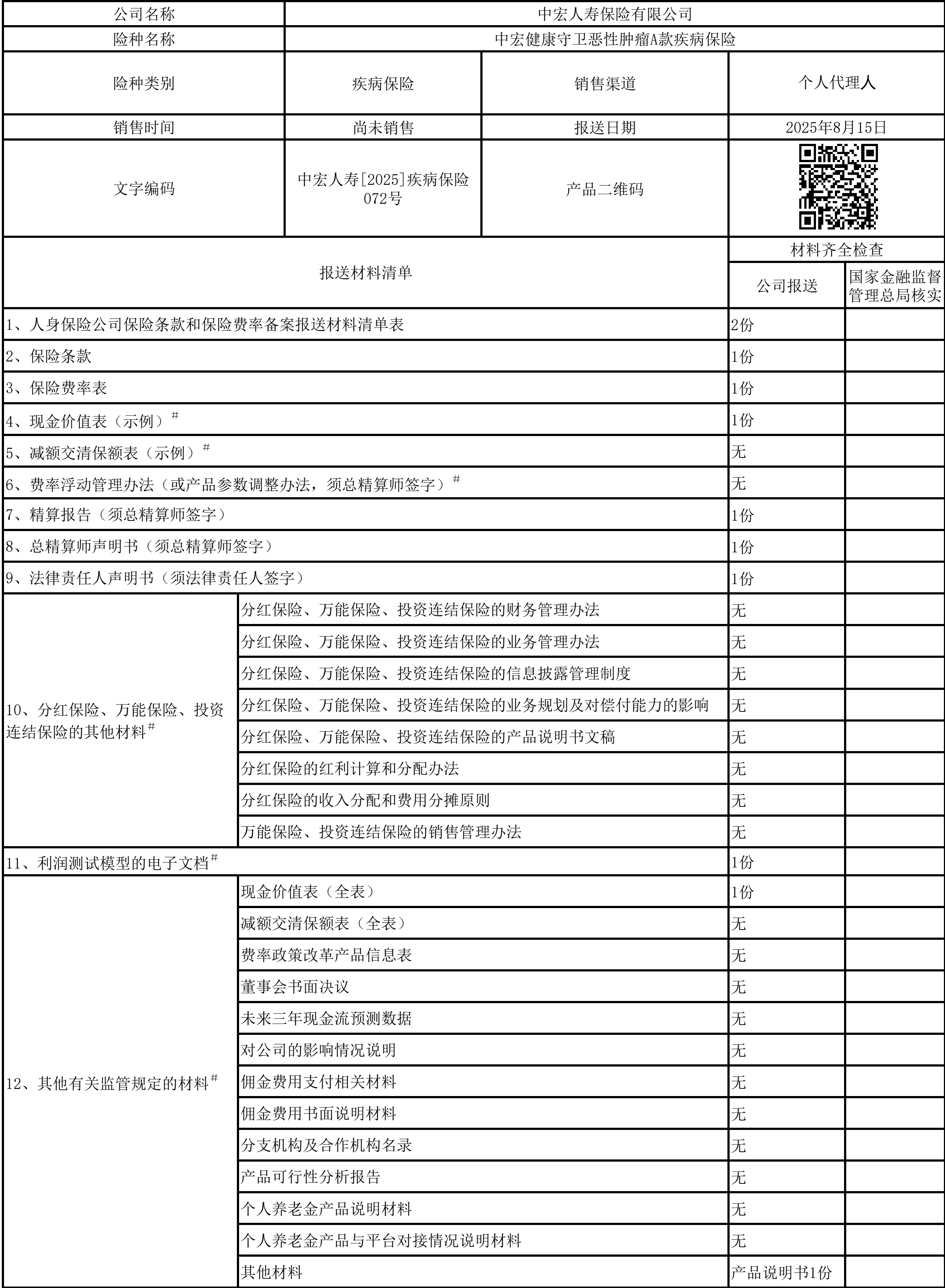
人身保险公司保险条款和保险费率备案报送材料清单表