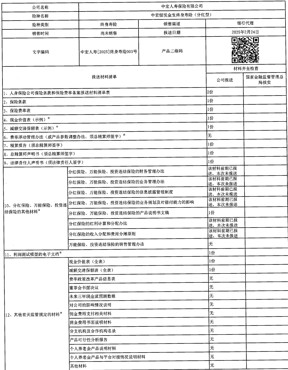
人身保险公司保险条款和保险费率备案报送材料清单表