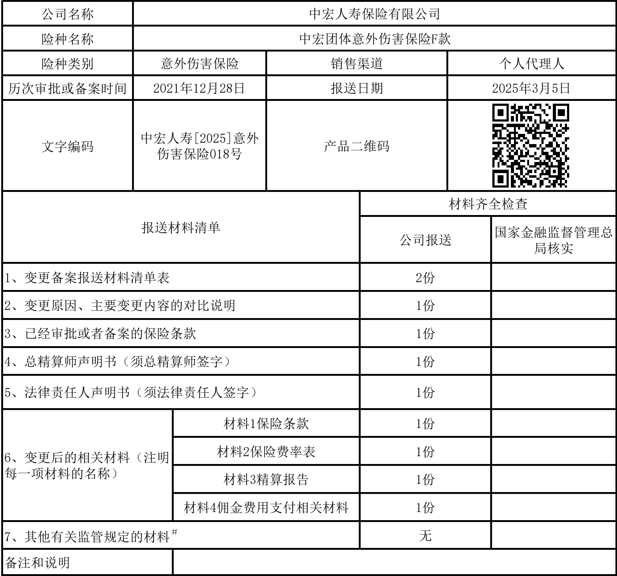
变更备案报送材料清单表