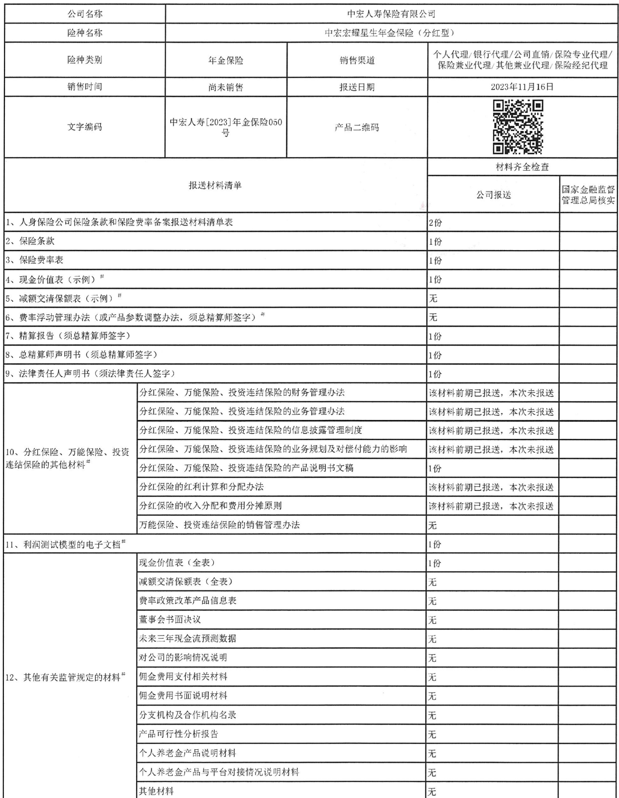
人身保险公司保险条款和保险费率备案报送材料清单表