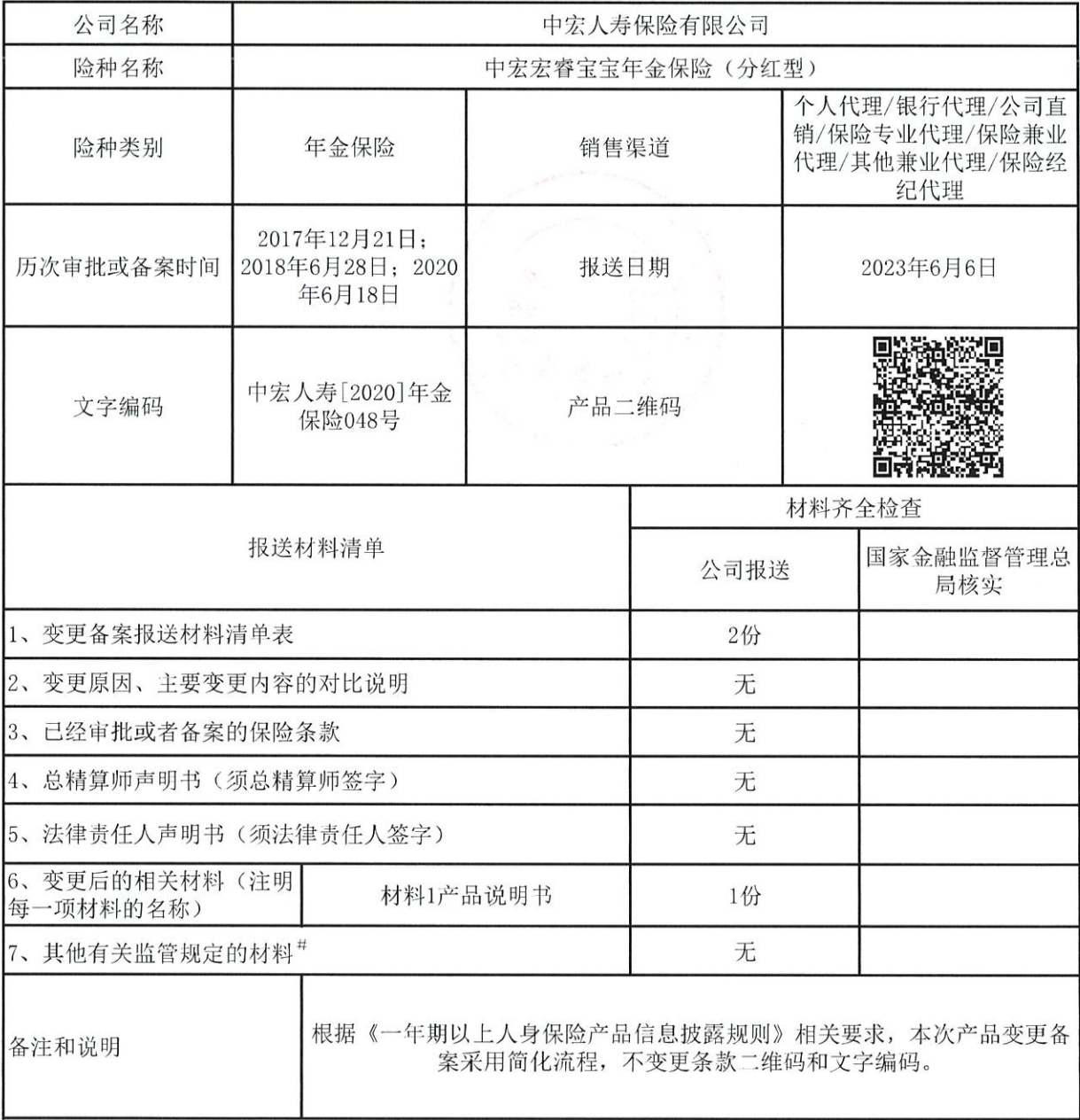
变更备案报送材料清单表