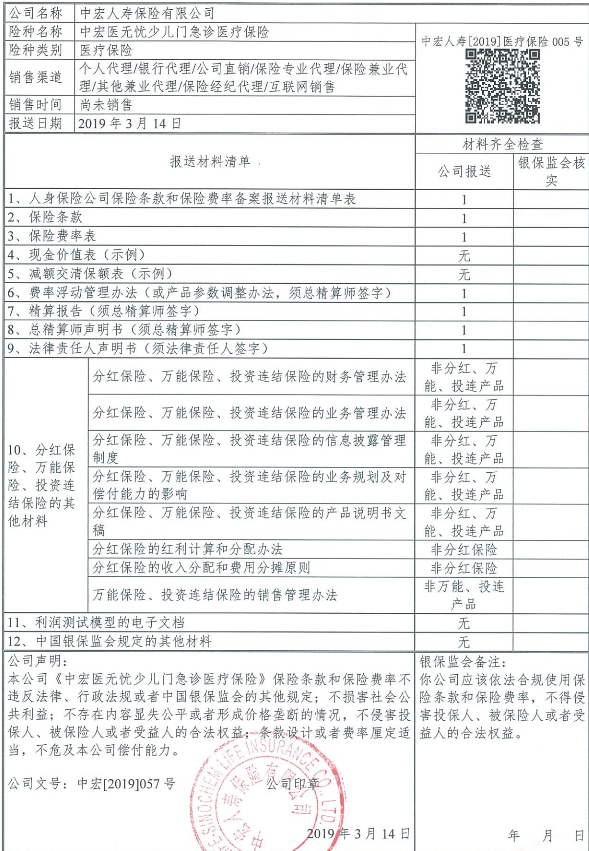
人身保险公司保险条款和保险费率备案报送材料清单表