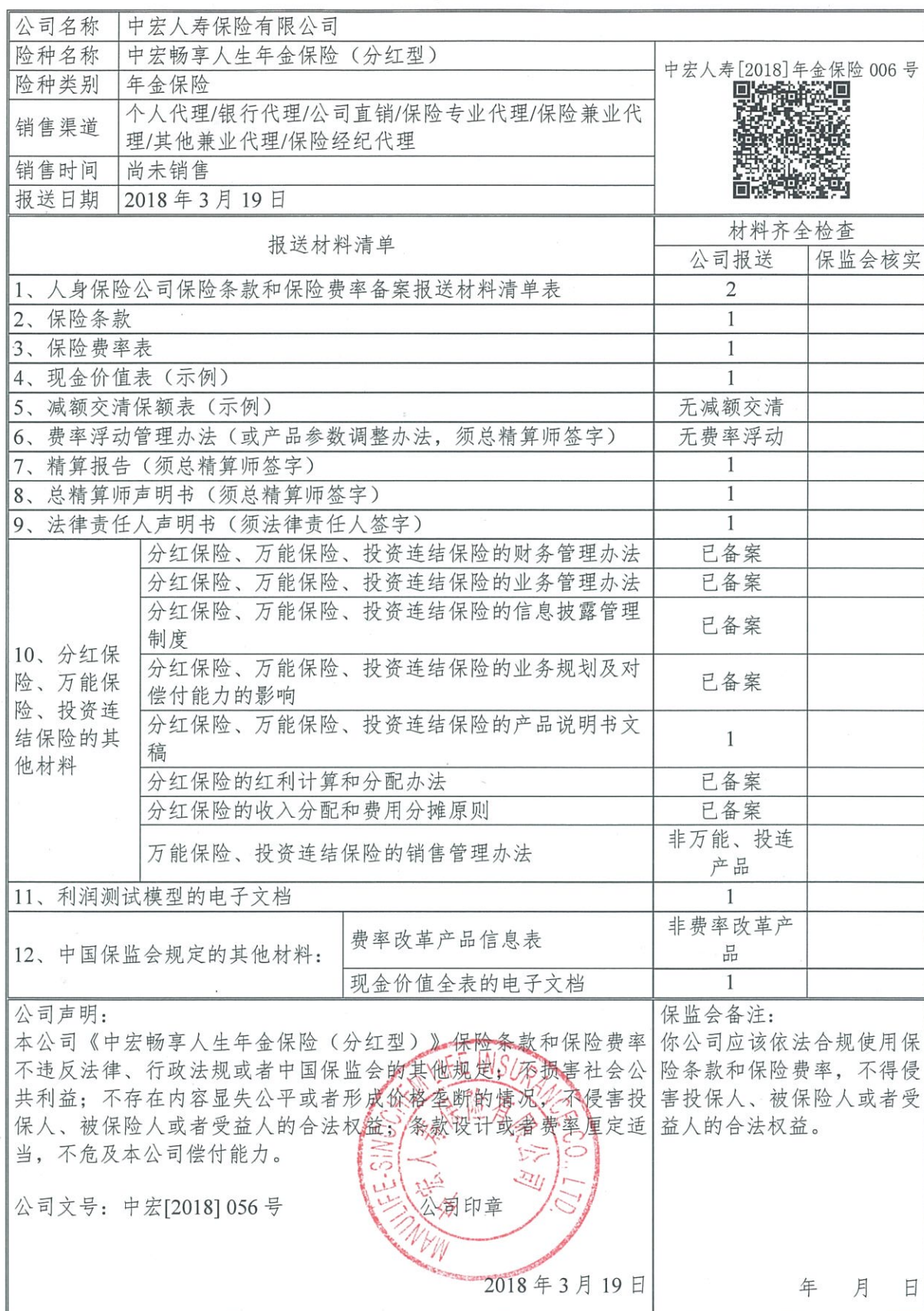
人身保险公司保险条款和保险费率备案报送材料清单表